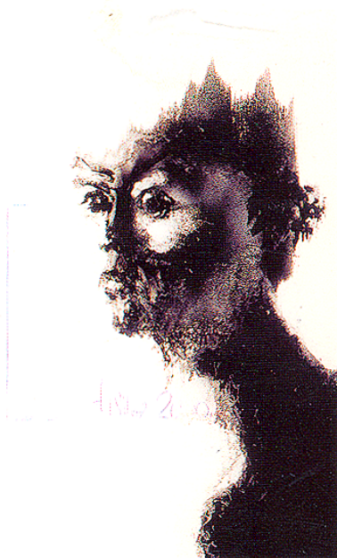
Véronique Sciboz: Acrylique, 77x57 cm, 2000