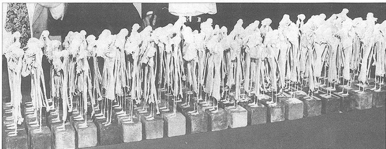
La longue marche, une sculpture de Yolande Biver